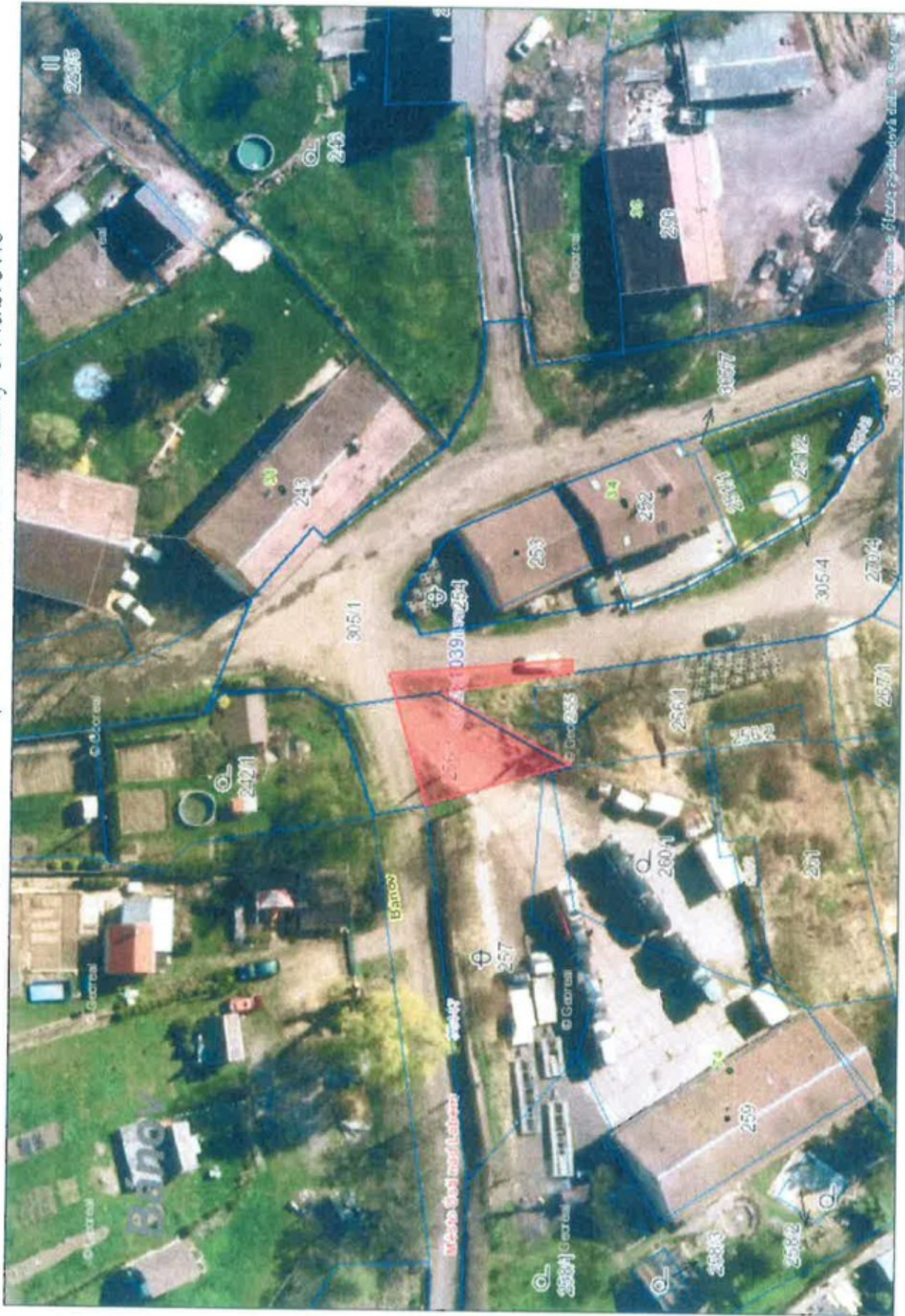
Části pozemků p. č. 256/3 a p. č. 305/1 v k. ú. Stražky u Habrovic