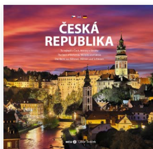
knihy Česká republika – To nejlepší z Čech, Moravy a Slezska

Libor Sváček se věnuje fotografii reklamní, technické a reportážní, fotografuje krajinu a architekturu, zaměřuje se mj. na leteckou fotografii. V roce 1992 založil vlastní fotostudio Expho, od roku 2005 úzce spolupracuje s Vydavatelstvím MCU, realizátorem výstavy. Výsledkem této dlouhodobé spolupráce je zatím 24 autorských fotografických publikací zaměřených na zachycení krásných a zajímavých míst České republiky a také desítky výstav u nás i v zahraničí. V současné době se připravuje do tisku 25. společný titul „Česká republika UNESCO“.