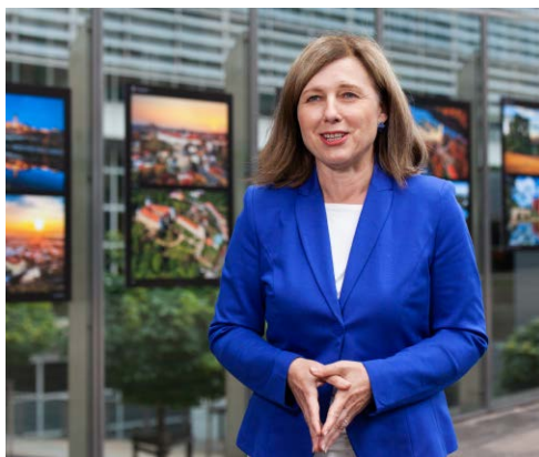
Věra Jourová na zahájení výstavy