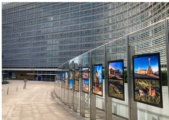
Výstava před budovou Evropské komise