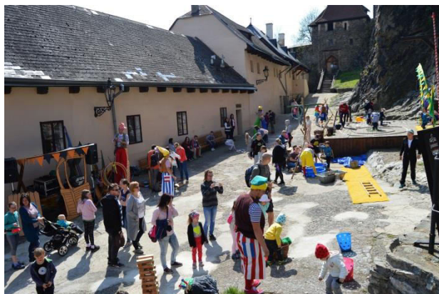
Obr. příloha B5: Akce Zahájení turistické sezóny, Střekov