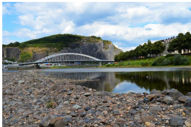
Obr. příloha A11: Mariánská skála a Benešův most