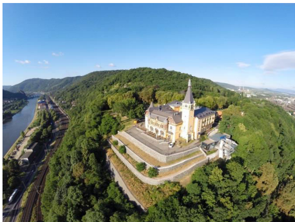
Obr. příloha A1: Výletní zámeček Větruše