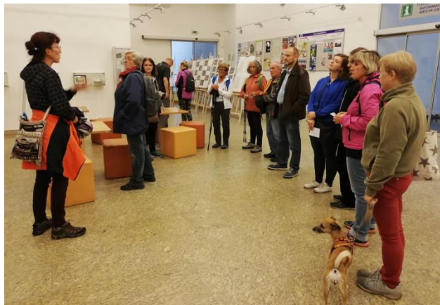
Obr. příloha C2: Sraz účastníků procházky (Světový den turismu)