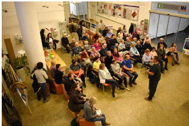
Obr. příloha C1: Přednáška pro veřejnost