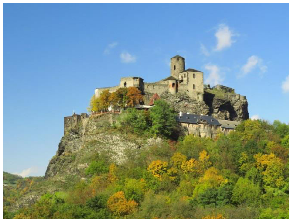
Obr. příloha A2: Zřícenina hradu Střekov