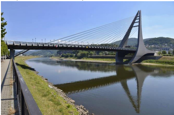
Obr. příloha A3: Mariánský most