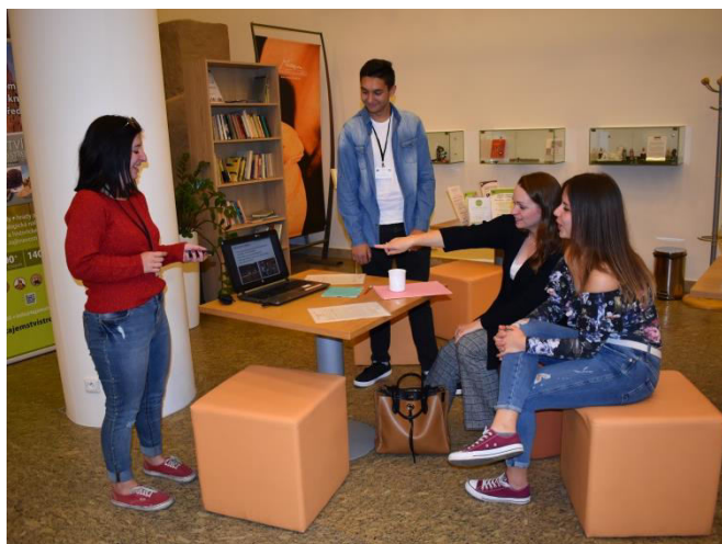
Obr. příloha C4: Odborná praxe- závěr. prezentace