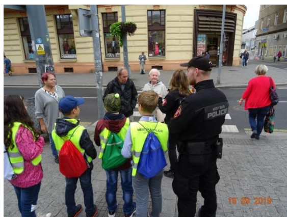
Obr. příloha D5: Evropský týden mobility