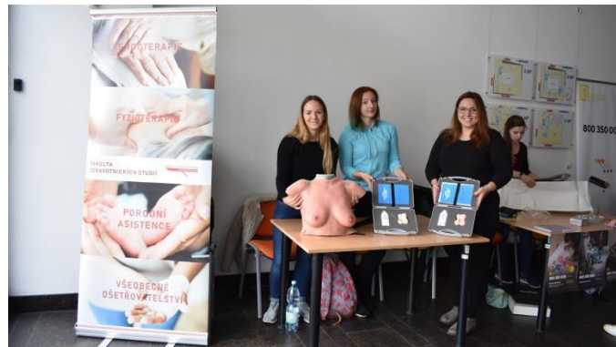
Obr. příloha D4: Den bez tabáku