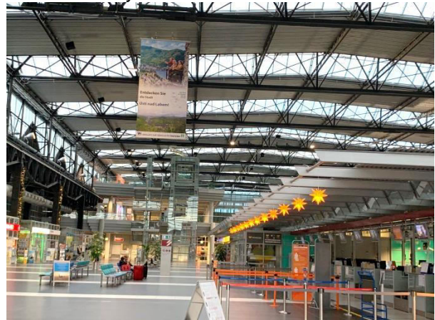
Obr. příloha B2: Pozvánka do regionu v terminálu Letiště Drážďany v období adventu