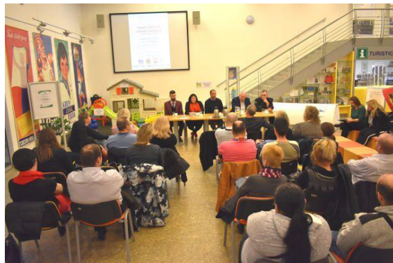
Obr. příloha D3: Veřejná diskuze s občany