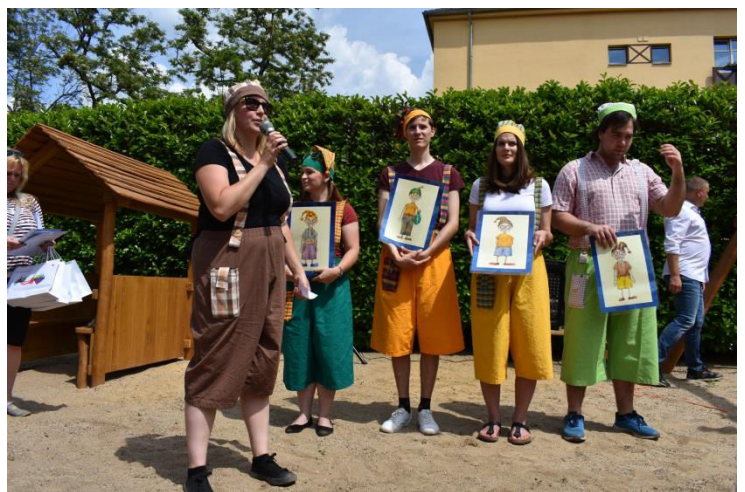
Obr. příloha B4: Křest Dlouhonohých skřítků