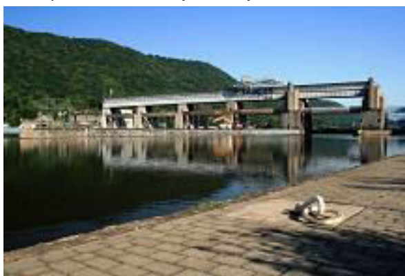
Obr. příloha A4: Masarykovo zdymadlo