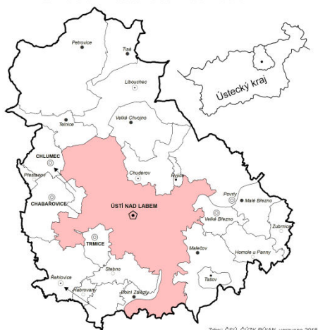
Okres a město Ústí nad Labem