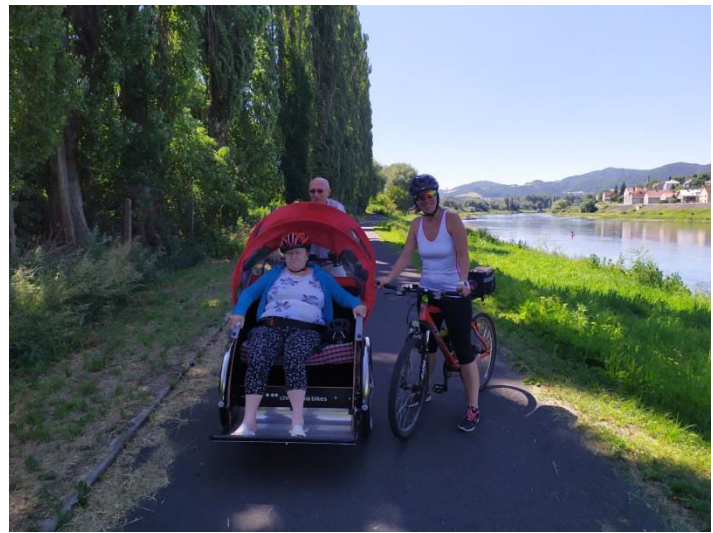
Obr. příloha D2: Cykloterapie – pilotní provoz