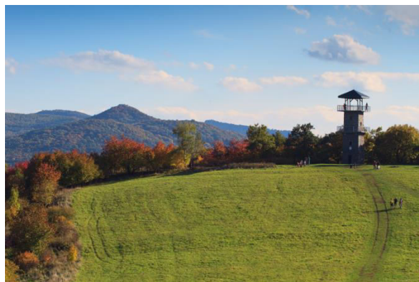
Obr. příloha A8: Erbenova vyhlídka