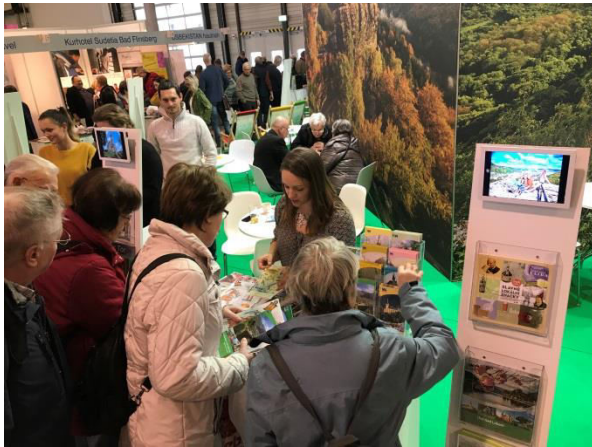
Obr. příloha B1: Veletrh cestovního ruchu