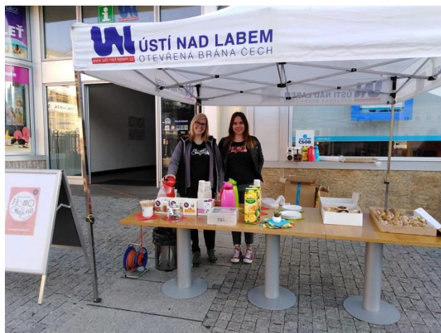
S Obr. příloha B3: Kampaň Do práce na kole – Snídaně na triko