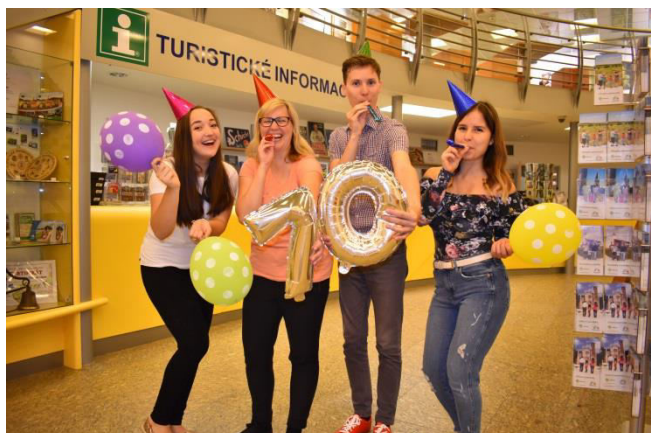
Obr. příloha C5: Informační středisko – 10. narozeniny