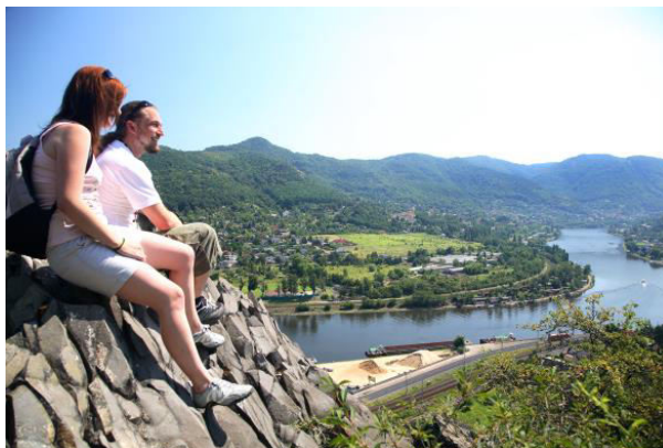
Obr. příloha A10: Skalní útvar Vrkoč