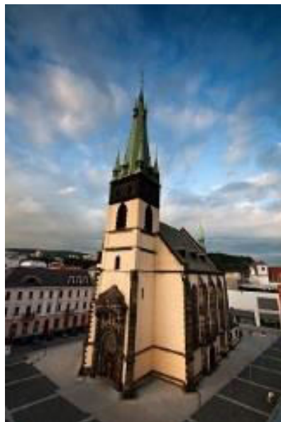
Obr. příloha A5: Kostel Nanebevzetí Panny Marie