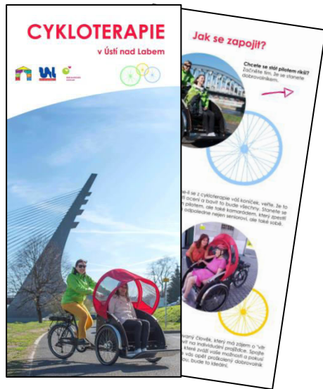
Obr. příloha D1: Informační leták k Cykloterapii