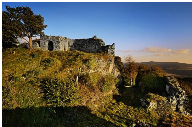
Obr. příloha A9: Zřícenina hradu Blansko