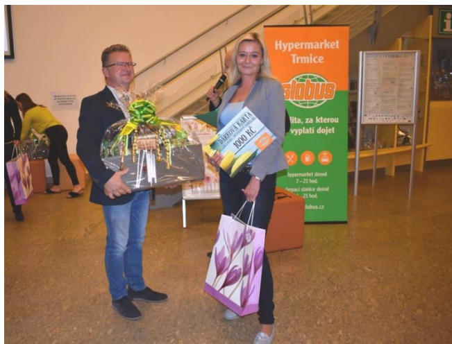
Obr. příloha C3: Předávání cen soutěže