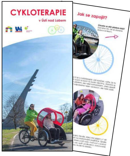
Obr. příloha D1: Informační leták k Cykloterapii