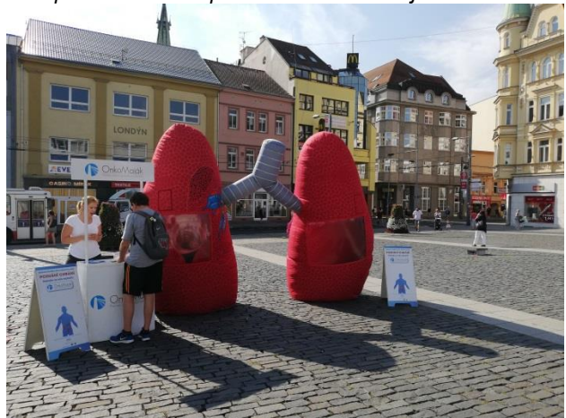
Obr. příloha B4: Den pro zdraví + Onkomaják