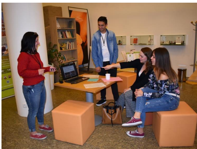
Obr. příloha C4: Odborná praxe- závěr. prezentace