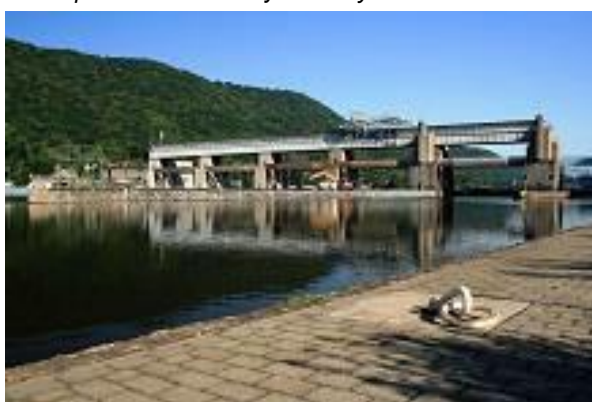
Obr. příloha A4: Masarykovo zdymadlo