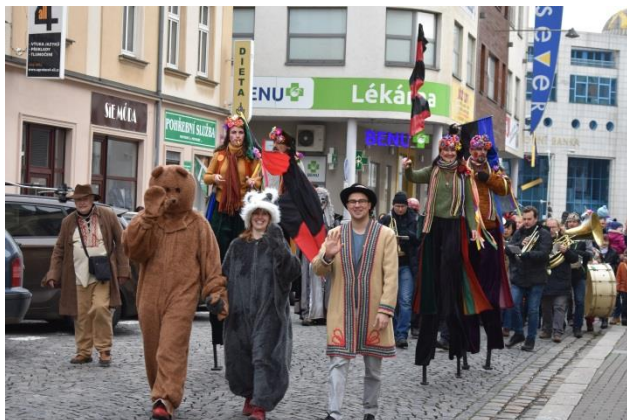
Obr. příloha B5: Ústecký masopust