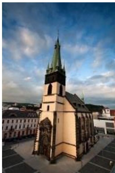
Obr. příloha A5: Kostel Nanebevzetí Panny Marie