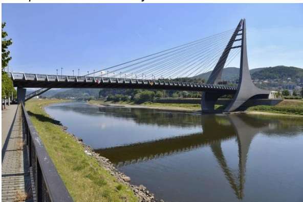
Obr. příloha A3: Mariánský most