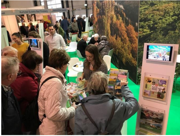
Obr. příloha B1: Veletrh cestovního ruchu