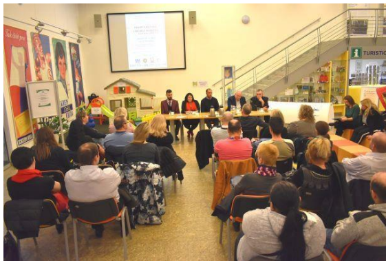
Obr. příloha D3: Veřejná diskuze s občany