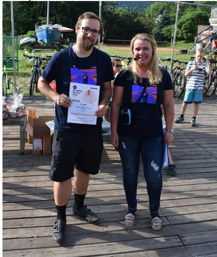
Obr. příloha C3: Předávání cen soutěže