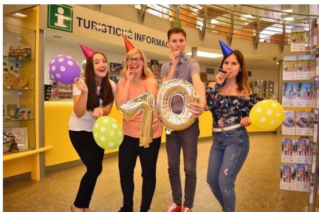
Obr. příloha C5: Informační středisko – 10. narozeniny