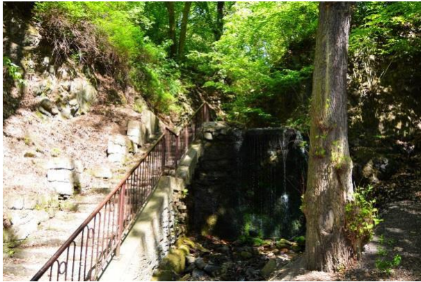
Obr. příloha A7: Bertino údolí