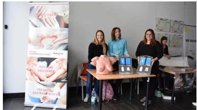
Obr. příloha D4: Den bez tabáku