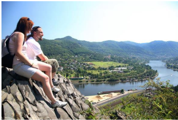
Obr. příloha A10: Skalní útvar Vrkoč