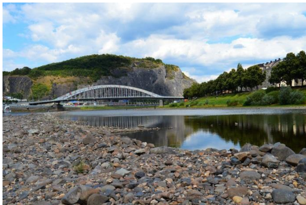
Obr. příloha A11: Mariánská skála a Benešův most