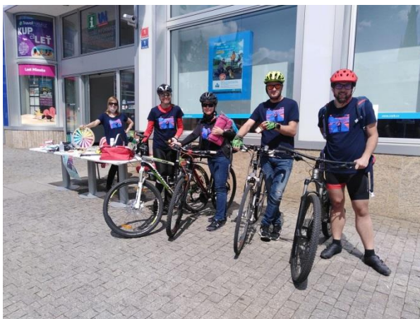
Obr. příloha B3: Kampaň Do práce na kole_Akce na triko