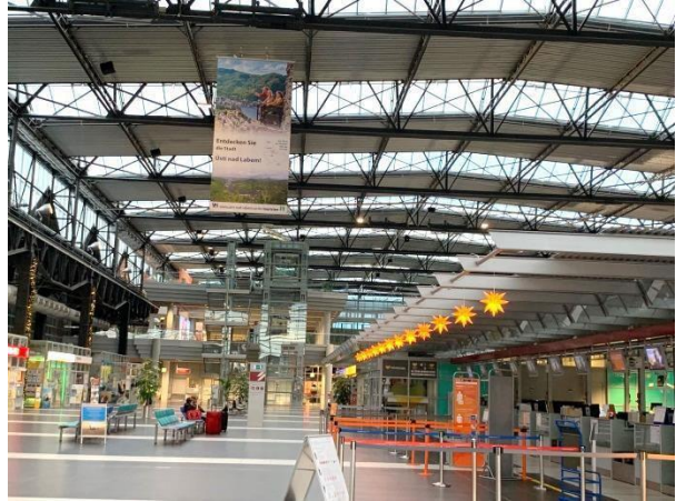
Obr. příloha B2: Pozvánka do regionu v terminálu Letiště Drážďany v období adventu