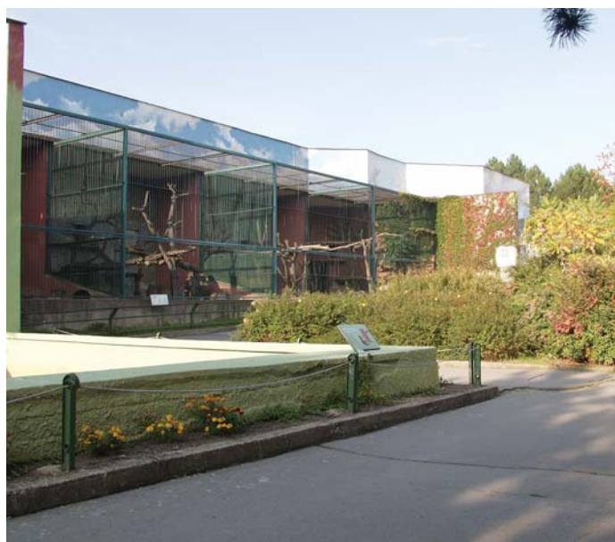
Současný výběh pro velké šelmy svým dispozičním řešením již nevyhovuje.