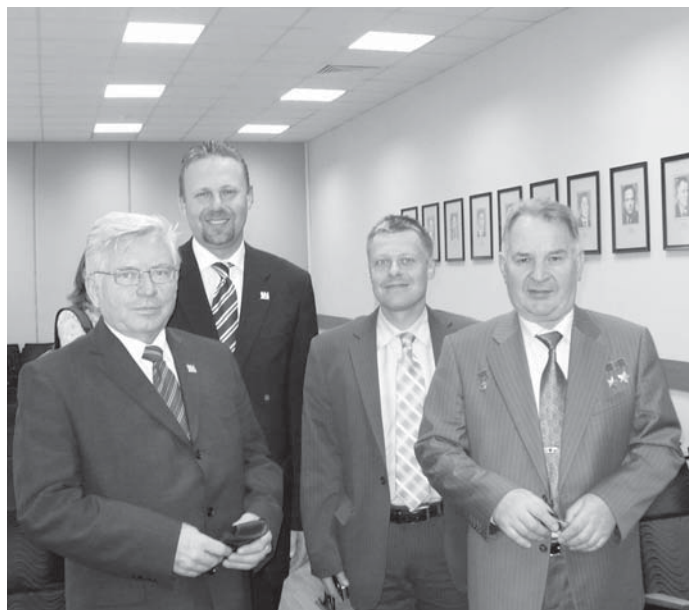
Zástupci města se ve Vladimíru rovněž setkali s čestným občanem tohoto města, legendárním kosmonautem V. Kubasovem (vpravo).

Co se týče ekonomiky, obě města se podle náměstka primátora Libora Turka dohodla na setkání ústeckých a vladimírských podnikatelů či ředitelů velkých podniků (např. z chemického průmyslu) s cílem navázat bližší kontakty. Do Vladimíru možná příští rok odjede i pracovní skupina Dopravního podniku města Ústí nad Labem, která by zde zmapovala mechanismus fungování městské dopravy, outsourcing autobusové dopravy, způsob financování, apod.