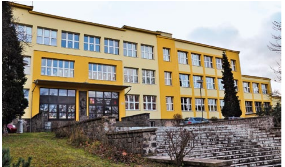
V ZŠ Karla IV. dojde k rekonstrukci a opravě rozvodů vody, odpadů a sociálních zařízení za dva miliony korun.