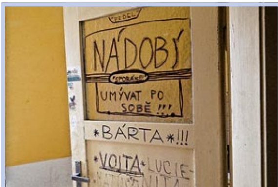
V prostorách využívaných do března 2014 bývalým souborem Činoherního divadla města Ústí nad Labem, o.p.s., bude nutné opravit příčky, vymalovat, opravit štuky, instalovat nové dveře a zárubně.

Na základě výše uvedených skutečností rozhodla Rada města Ústí nad Labem na zasedání dne 9. 6. 2014 o dalších právních krocích s tím, že případné vymožení škod ze strany odpovědných osob by mohlo vést k uspokojení alespoň části pohledávek města.