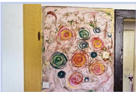
Dalších 500.000 Kč půjde na opravy z úspor v neinvestiční části městského rozpočtu.