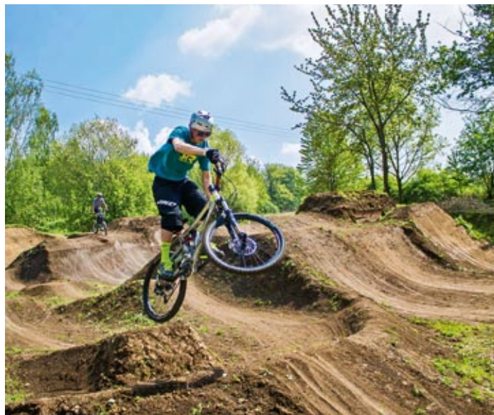
Pro nadšence extrémní cyklistiky byl na Střížovickém vrchu vybudován bikepark, který zde bude sloužit jak amatérům, tak i profesionálním jezdcům.

Další aktivity města budou směřovat k tomu, aby ve spolupráci s místními spolky vznikl na Střížovickém vrchu rozsáhlejší areál takzvaných singltreků, úzkých cestiček určených pro jednoho jezdce plně oddělených od pěšího vycházkového provozu. Zároveň je navržen pro trénink a provádění i těch nejnáročnějších triků.