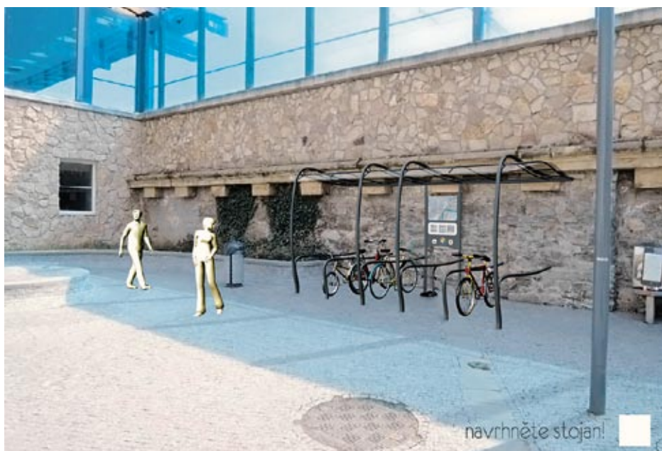
V soutěži „Navrhňte stojan“ zvítězil projekt architekta Jana Soukupa.