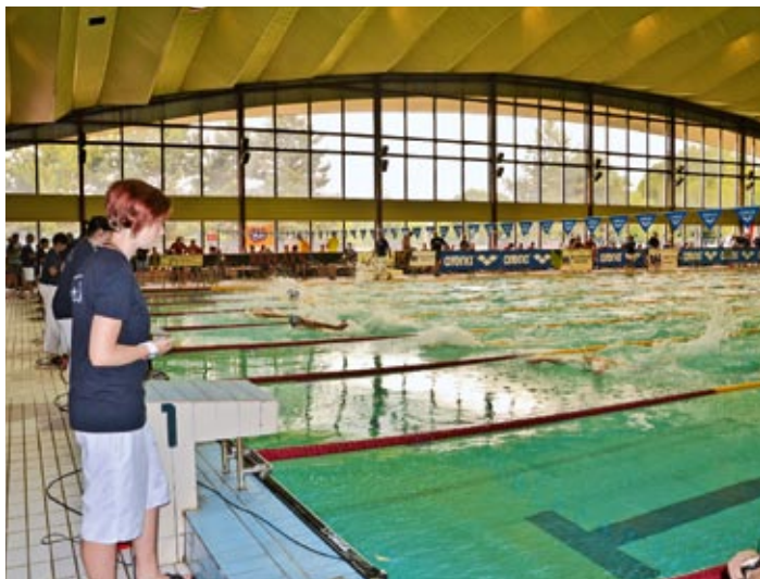
Plavecká hala byla v provozu do června. Poté budou zahájeny přípravy na rekonstrukci, která bude ukončena do konce roku 2015. Plavci se poté mohou těšit na nové moderní prostory. Venkovní bazén areálu na Klíši však bude k dispozici tak dlouho, jak stavba dovolí.