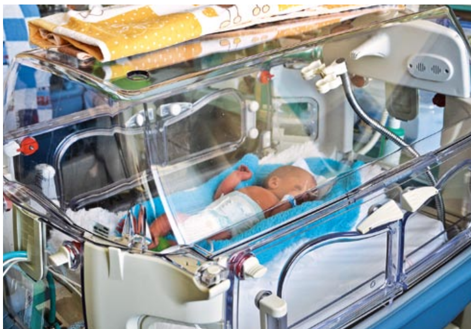
Na červnové schůzi nikdy ze zastupitelů nebyl proti záměru poskytnout Masarykově nemocnici tento dar.

dlouhodobě a pravidelně spolupracuje s Masarykovou nemocnicí a podporuje ji.