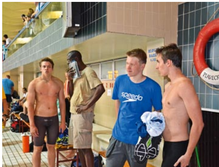
Jeden z posledních závodů, které se konaly v původní plavecké hale, bylo letní mistrovství České republiky dorostu v plavání. Konalo se od pátku 20. 6. do neděle 22. 6. za velké účasti plavců i diváků.