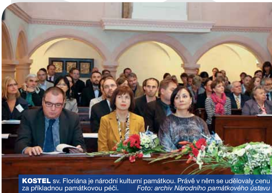
KOSTEL sv. Floriána je národní kulturní památkou. Právě v něm se udělovaly cenu za příkladnou památkovou péči.

Národní památkový ústav, příspěvková organizace Ministerstva kultury České republiky, vyhlásil cenu