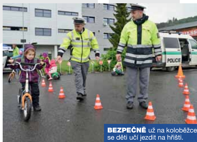
BEZPEČNĚ už na koloběžce se děti učí jezdit na hřišti.