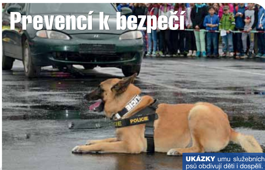
UKÁZKY umu služebních psů obdivují děti i dospělí.

V preventivních programech pro děti se zaměřili především na bezpečný pohyb na silnici a u školy. Děti dále seznamovali s nezbytným vybavením kola i cyklisty a s významem reflexních prvků. Další přednášky a besedy Policie ČR zaměřila na pravidla bezpečného chování při setkání dětí s neznámým člověkem či na problematiku šikany a kyberšikany. Policisté s dětmi probírali rizika, hrozící na sociálních sítích, informovali je o funkci tísňových linek, varovali před vandalismem a droga-