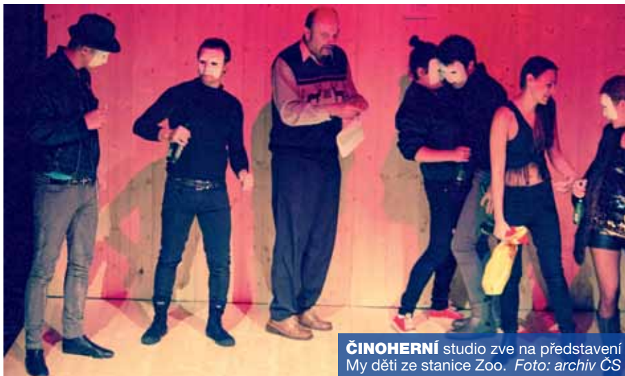
ČINOHERNÍ studio zve na představení My děti ze stanice Zoo .