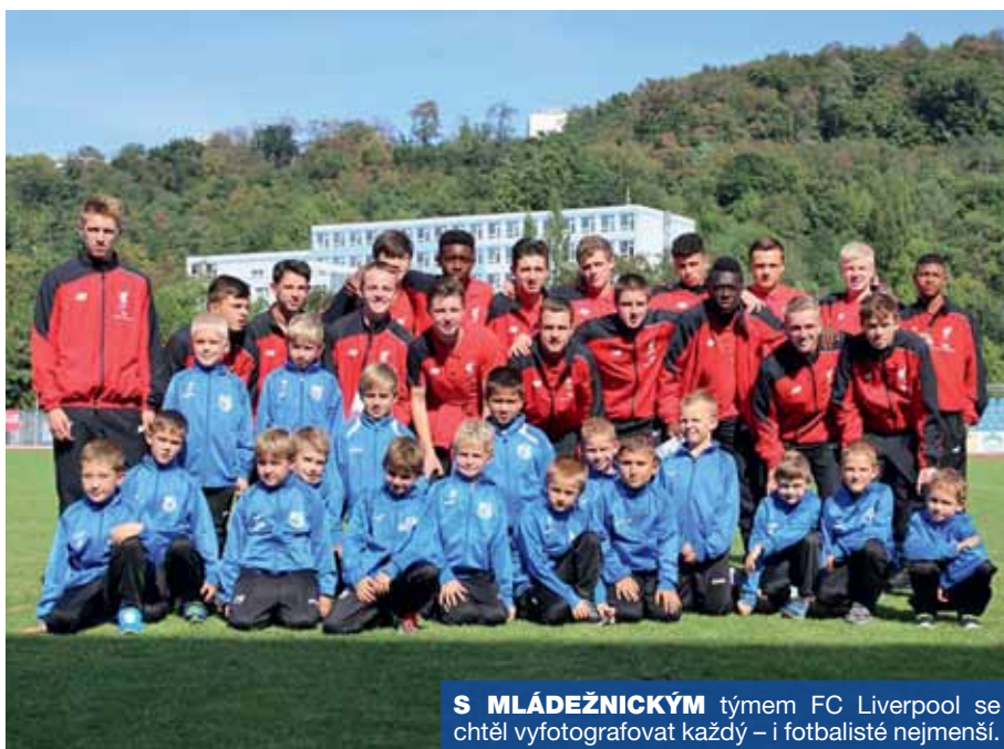
S MLÁDEŽNICKÝM týmem FC Liverpool se chtěl vyfotografovat každý – i fotbalisté nejmenší.