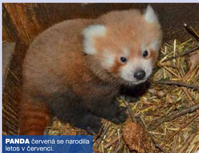
PANDA červená se narodila letos v červenci.