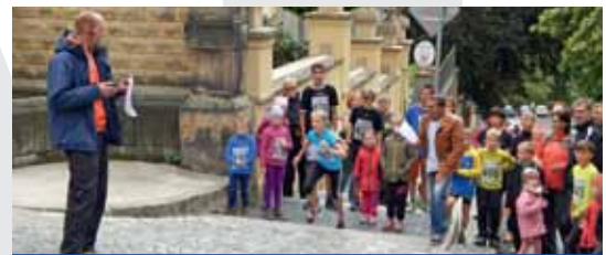
BĚH strmou ulicí nadchl řadu dětí.