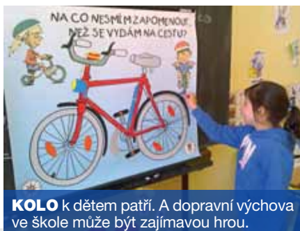
KOLO k dětem patří. A dopravní výchova ve škole může být zajímavou hrou.

Třináct základních škol, tři školy střední, Mateřskou školu Zvoneček, tři kluby a domovy seniorů navštívili od začátku letošního roku příslušnice a příslušníci Policie ČR Ústí nad Labem.