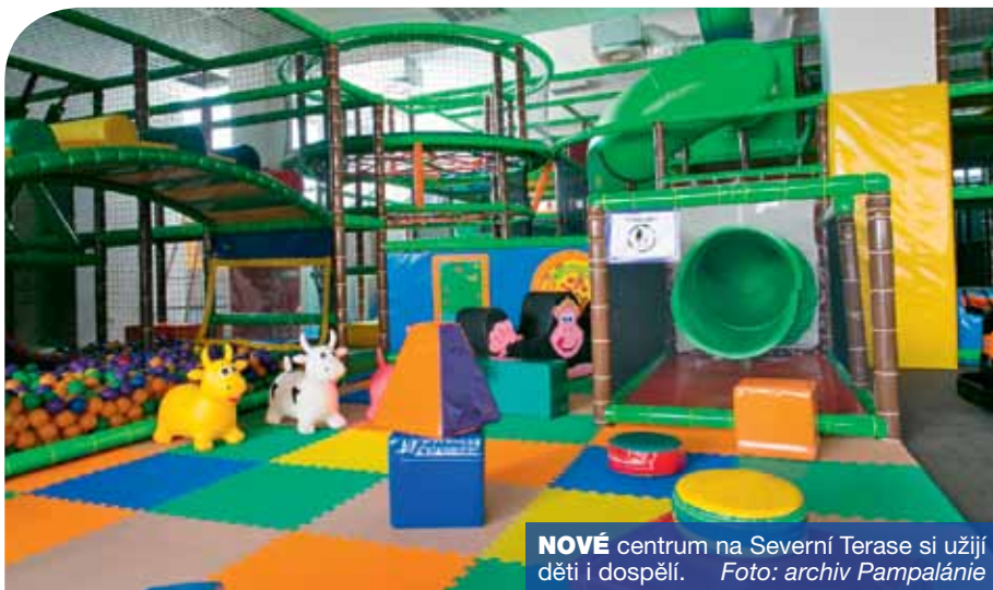
NOVÉ centrum na Severní Terasě si užijí děti i dospělí.