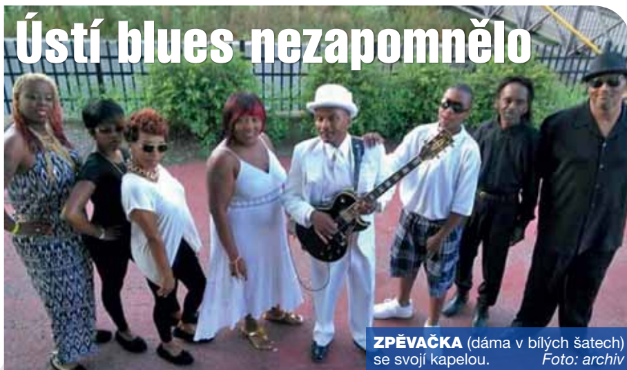
ZPĚVAČKA (dáma v bílých šatech) se svojí kapelou.

Úspěchů této zpěvačky by bylo možné psát eseje, ale bráno z pohledu diváka koncertu lze jen konstatovat, že tato mimo jiné i praneteř legendárního Muddyho Waterse do Ústí nad Labem přivezla koktejl skvělých písní a naprosto dech beroucího přednesu. Sporý tanec, kterým doprovázela svůj zpěv, byl jen ukázkou toho, jak svým opravdovým blues drobnými kroky prozpívala a protančila celými Spojenými státy americkými. Tanec jen dokresloval majestátnost hlasu, kterým s naprostým přehledem a jistotou v každém tónu doručila ústeckému publiku pozdrav ze svého rodného Ohia. Síla osobnosti, zkušenost a přece dokonalá profesionalita se za neopomenutelného doprovodu jejího bandu jen nesla sálem. A jedním dechem je nutné dodat, že ústecké publikum tuto hozenou rukavici zvedlo a každá píseň