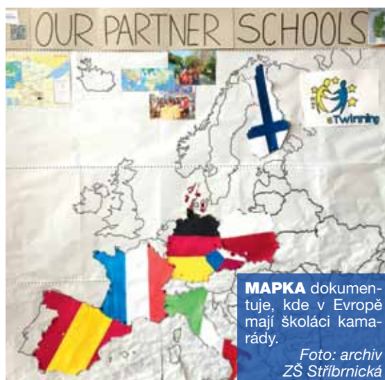
MAPKA dokumentuje, kde v Evropě mají školáci kamarády.