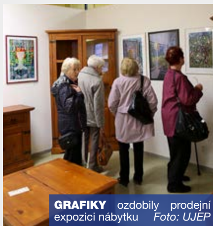
GRAFIKY ozdobily prodejní expozici nábytku

Multifunkčního informačního a vzdělávacího centra UJEP v Kampusu UJEP, bude otevřena od 26. listopadu.