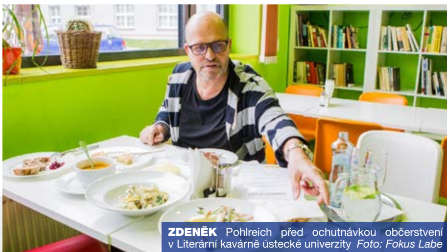
ZDENĚK Pohlreich před ochutnávkou občerstvení v Literární kavárně ústecké univerzity

Tak těmito, pro něj typickými slovy, zhodnotil činnost neziskové organizace Fokus Labe Zdeněk Pohlreich .