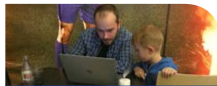
ZÁJEMCI z řad veřejnosti si mohli s přírodovědci popovídat v Café IN v OC Forum

Dne 5. 11. to byl „Jeden den na veřejně“ určený především studentům středních škol, aby si vyzkoušeli vysokoškolské studium na vlastní kůži. Soutěžili přitom o hodnotné ceny. Dne 12. 11. 2015 se vědci přesunuli do centra města, kon-