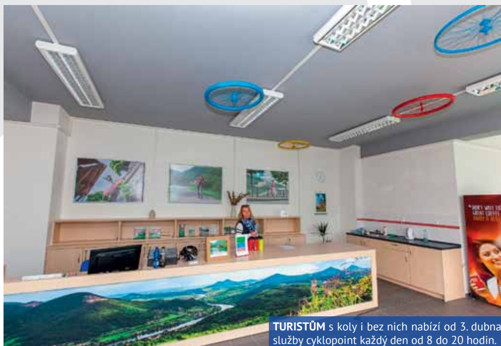
TURISTŮM s koly i bez nich nabízí od 3. dubna služby cyklopoint každý den od 8 do 20 hodin.