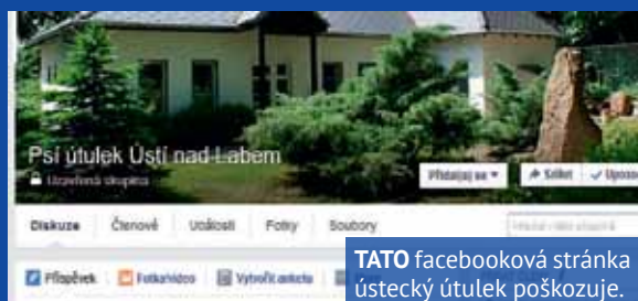
TATO facebooková stránka ústecký útulek poškozující.