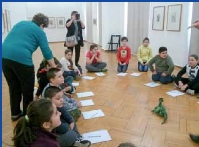
EXKURZE do muzeí a galerií rovněž patří k inkluzivnímu vzdělávání. Zde se uplatňují dovednosti a znalosti žáků v reálných situacích.

PaedDr. Petr Brázda, KSČM, zastupitel města Ústí nad Labem