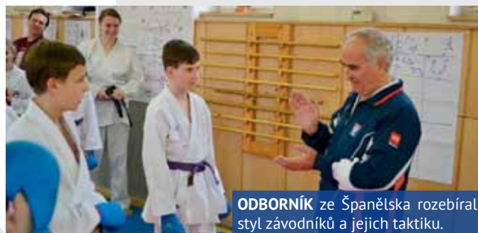
ODBORNÍK ze Španělska rozebíral styl závodníků a jejich taktiku.