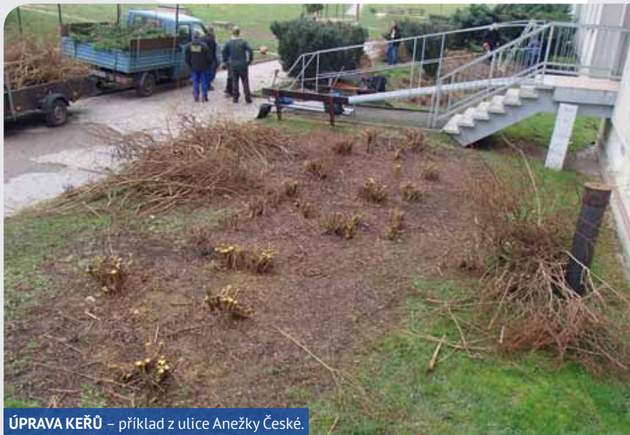
ÚPRAVA KEŘŮ – příklad z ulice Anežky České.

ZA TO ALE NEŠTĚMICKÁ RADNICE NEMŮŽE. LONI MĚLA STOVKU VEŘEJNĚ PROSPĚŠNÝCH PRACOVNÍKŮ. LETOS ZATÍM NEMÁ ANI POLOVINU.