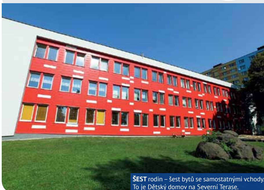
ŠEST rodin – šest bytů se samostatnými vchody. To je Dětský domov na Severní Terasě.