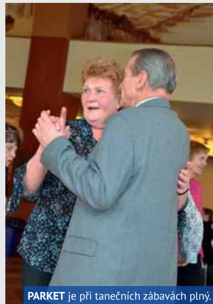
PARKET je při tanečních zábavách plný.

čtvrtek od 10 hodin, pro změnu ale v restauraci Domu kultury.