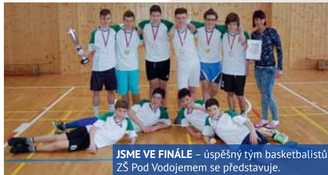
JSME VE FINÁLE – úspěšný tým basketbalistů ZŠ Pod Vodojemem se představuje.

Do Ústí nad Labem se sjelo celkem pět škol z celého kraje. V žádném ze zápasů nesměli tedy chlapci zaváhat. Cíl byl jasný – vybojovat si postup na republikové finále. Chlapci podali vynikající výkony, vždy věděli, jak soupeře překvapit. O umístění rozhodl až poslední zápas proti Litoměřicím (loňský vítěz), který byl do poslední chvíle velmi vyrovnaný, ale nakonec jsme soupeřům utekli a konečným výsledkem