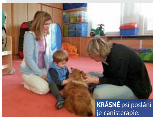
KRÁSNE psí poslání je canisterapie.