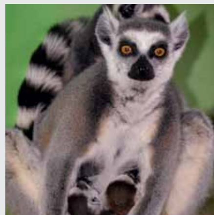
BABY BOOM U LEMURŮ – čtyři maminky nosí celkem šest mláďat, navzájem si je očichávají a olizují. Nejmladší z mláďat jsou na bříše, starší již na zádech maminek.