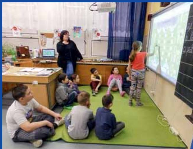
NIŽŠÍ POČET žáků ve skupině je charakteristickým znakem inkluzivního vzdělávání ve škole. Stejně tak používání moderních pomůcek.