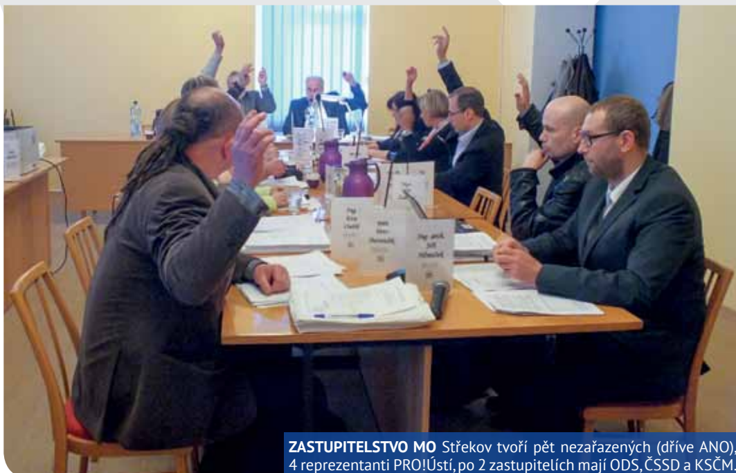
ZASTUPITELSTVO MO Střekov tvoří pět nezařazených (dříve ANO), 4 reprezentanti PRO!Ústí, po 2 zastupitelích mají ODS, ČSSD a KSČM.

Veřejné 10. mimořádné jednání Zastupitelstva MO Střekov bylo svoláno na 26. dubna 2016 od 16 hodin. Předmětem jednání zastupitelstva budou především běžné záležitosti občanů Střekova, jmenování dvou nových vedoucích odborů úřadu MO Střekov a dále pak různé provozní záležitosti městského obvodu. Jde tedy o záležitosti, které jinak náležejí do pravomoci Rady MO Střekov.