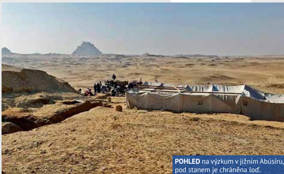
POHLED na výzkum v jižním Abúsíru, pod stanem je chráněna loď.