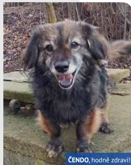
ČENDO, hodně zdraví!

I když sám Čenda nový domov vlastně už ani nehledá. „ Je mu kolem sedmnácti let a z toho pět let žije u nás. Cítí se tu bezpečně, těžko by si ve svém věku zvykal někde jinde a noví páníčci na něj. Nemá rád jakoukoli manipulaci s ním, třeba i nasadit mu košík je velký problém, vevnitř neumí dodržovat čistotu a nemůže být ani sám na zahradě, protože utíká. Už jednou v adopci byl,