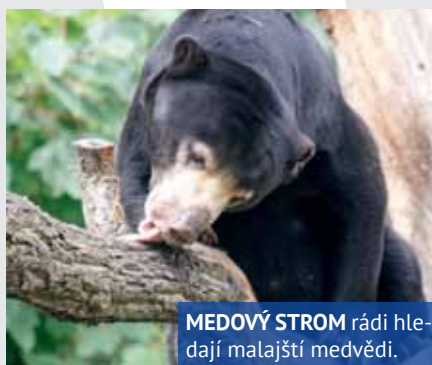
MEDOVÝ STROM rádi hledají malajští medvědi.

Skautský den v zoo je již 12. ročníkem oblíbené akce, která probíhá v celém areálu se zaměřením na soutěže s přírodovědnou tematikou.