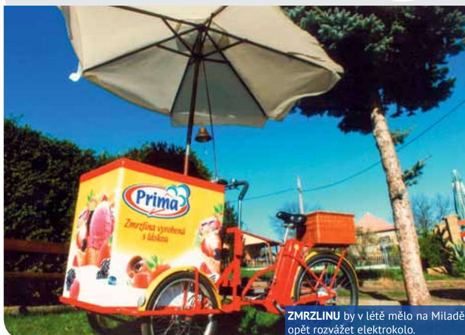
ZMRZLINU by v létě mělo na Miladě opět rozvážet elektrokolo.