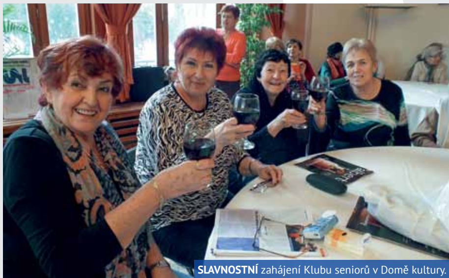
SLAVNOSTNÍ zahájení Klubu seniorů v Domě kultury.