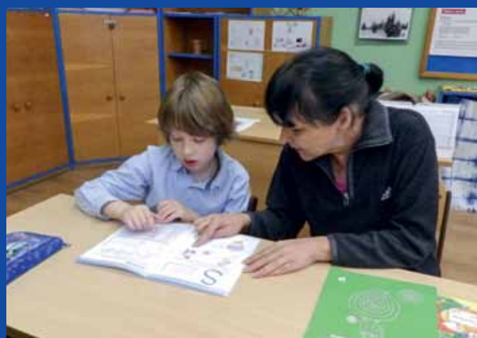
ASISTENTKY pedagoga, které pomáhají zprostředkovat učivo žákům, jsou nedílnou součástí společného vzdělávání.