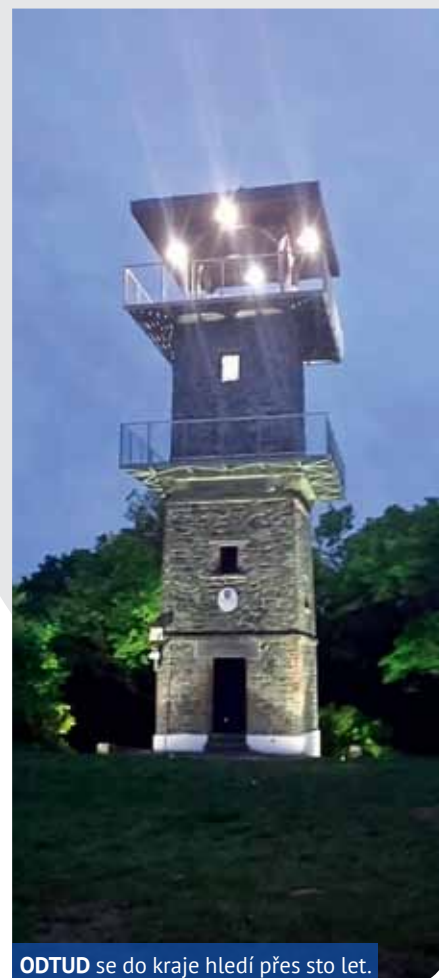
ODTUD se do kraje hledí přes sto let.

Na procházku zve MO Severní Terasa