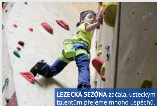
LEZECKÁ SEZÓNA začala, ústeckým talentům přejeme mnoho úspěchů.

Text a foto: Mgr. Kamila Turková, Ing. Lucie Gerychová, ZŠ Pod Vodojemem