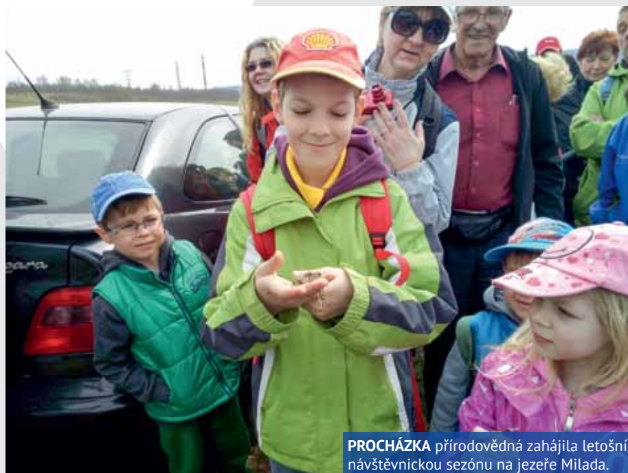
PROCHÁZKA přírodovědná zahájila letošní návštěvnickou sezónu na jezeře Milada.

První akce pro veřejnost se na Miladě konala u příležitosti Mezinárodního dne vody. Přírodovědnou procházku, deset kilometrů dlouhý vycházkový okruh kolem jezera, si nenechalo ujít na šest desítek lidí – a to jak rodiny s malými dětmi, tak zdatní senioři. Cestou potkali ropuchu obecnou, ropuchu zelenou, skokana hnědého, slepýše, lísky a roháče, labutě i po-