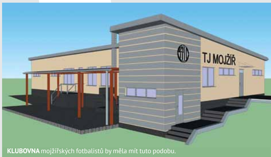
KLUBOVNA mojžířských fotbalistů by měla mít tuto podobu.

Na údržbě zeleně se v neštěmickém obvodu podílejí – až do příštího roku, kdy jim končí rámcové smlouvy – čtyři firmy. Pořádný kus práce ovšem při údržbě zeleně loni odvedli rovněž veřejně prospěšní pracovníci. Radnice jich měla k dispozici stovku. Díky tomu mohla například údržba keřů probíhat celoročně. A také operativně. Pokud občané na radnici zavolali, že jim stromy nebo keře začínají zasahovat do oken, na firmy se čekat nemuselo. Radnice na příslušné místo vyslala své zaměstnance, tedy veřejně prospěšné pracovníky. K úbytku houštin přispěla i spolupráce s Městskou policií a Poli-