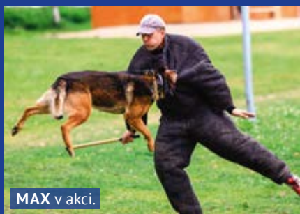
MAX v akci.