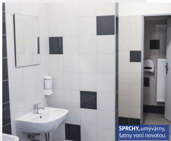
SPRCHY, umývárny, šatny voní novotou.

Yveta Tomková (Vaše Ústí), starostka MO Neštěmice