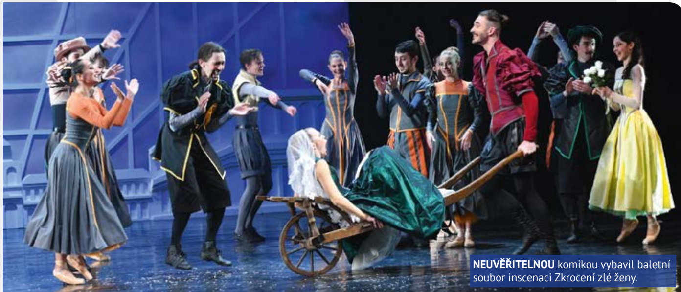
NEUVĚŘITELNOU komikou vybavil baletní soubor inscenaci Zkrocení zlé ženy.

ZKROCENÍ ZLÉ ŽENY NASTUDOVANÉ BALETNÍM SOUBOREM SEVEROČESKÉHO DIVADLA V ÚSTÍ NAD LABEM MI ROZMAZALO MAKE-UP, ROZBOLELO BRÁNICI A POMUCHLALO ŠATY.