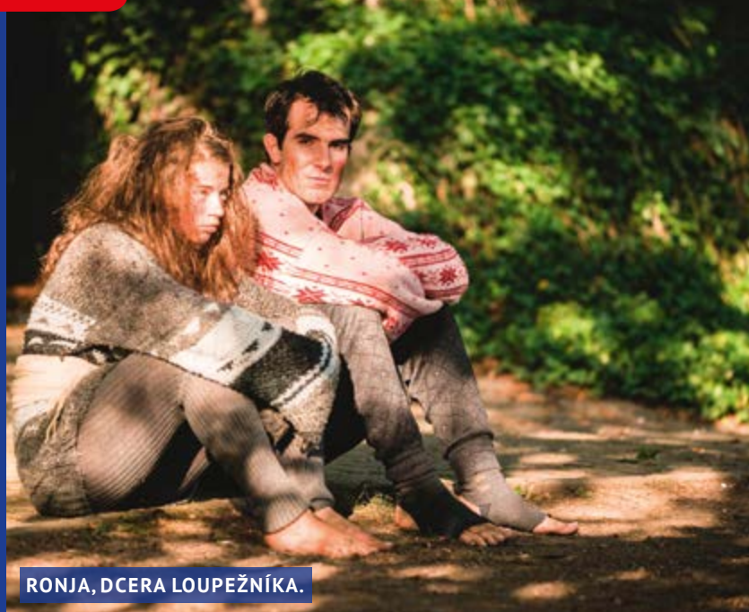
RONJA, DCERA LOUPEŽNÍKA.