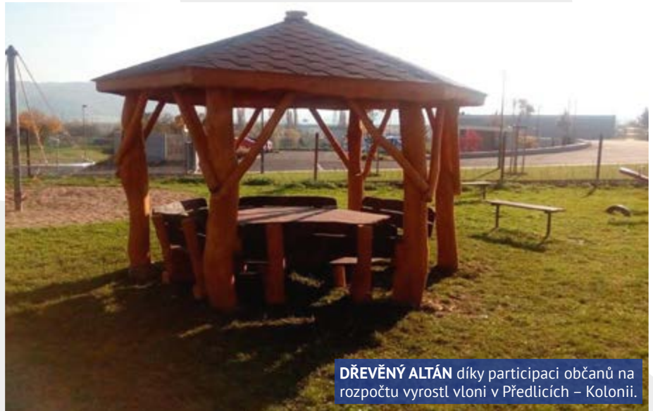
DŘEVĚNÝ ALTÁN díky participaci občanů na rozpočtu vyrostl vloni v Předlicích – Kolonii.