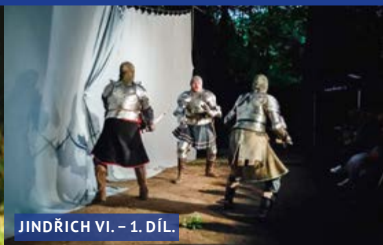
JINDŘICH VI. – 1. DÍL.