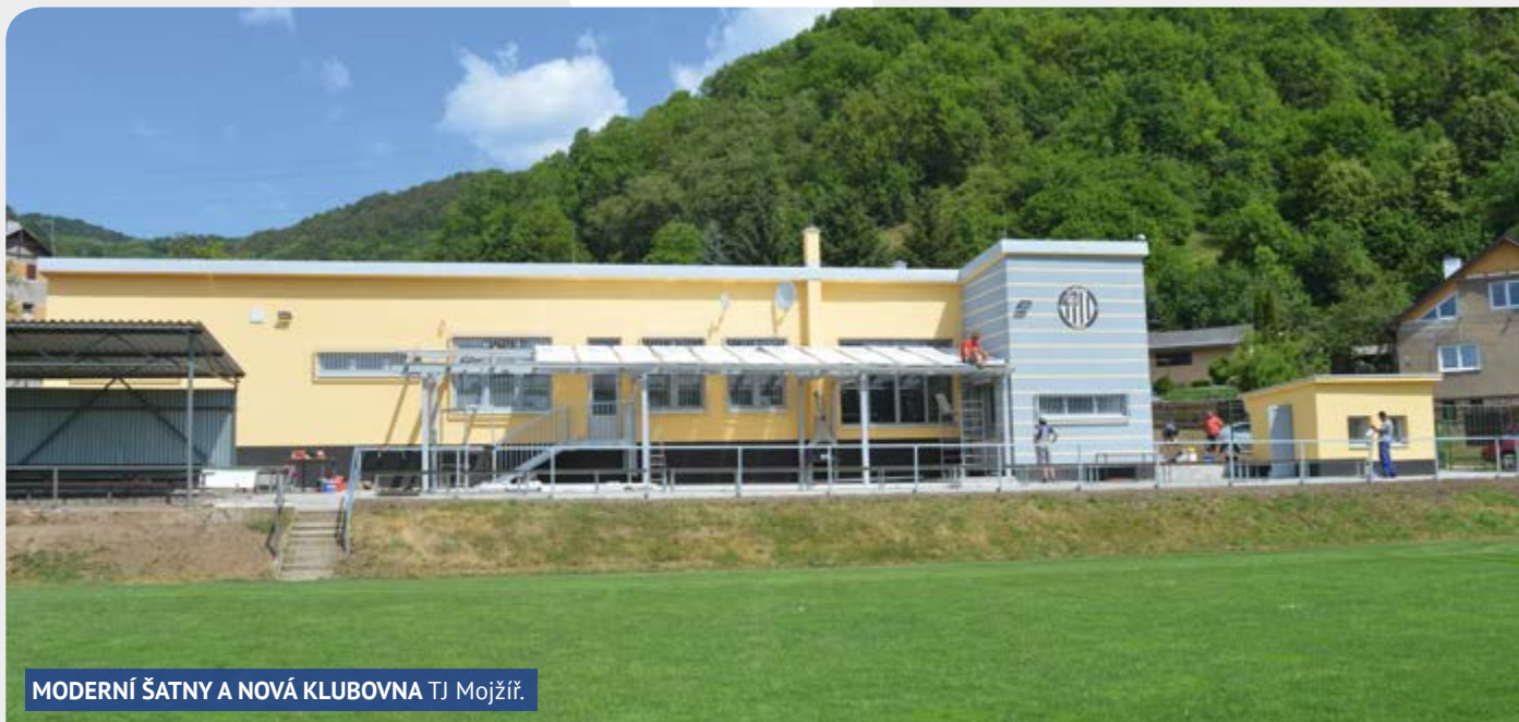
MODERNÍ ŠATNY A NOVÁ KLUBOVNA TJ Mojžíř.

MĚSTSKÝ OBVOD ÚSTÍ NAD LABEM – NEŠTĚMICE DOKONČIL NA KONCI KVĚTNA NEJVĚTŠÍ INVESTIČNÍ AKCI TOHOTO VOLEBNÍHO OBDOBÍ, KTEROU BYLA REKONSTRUKCE KABIN NA FOTBALOVÉM STADIONU V MOJŽÍŘI.