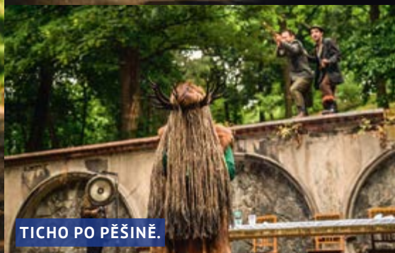
TICHO PO PĚŠINĚ.