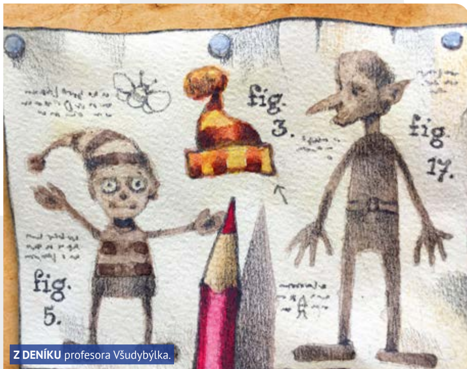
Z DENÍKU profesora Všudybýlka.