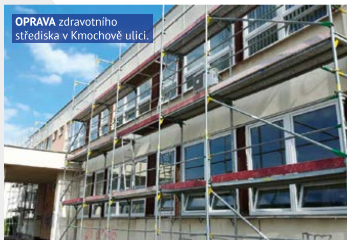
OPRAVA zdravotního střediska v Kmochově ulici.

V CENTRÁLNÍM PARKU NA DĚTSKÉM HŘIŠTI SE STAVÍ ZÁKLADY NOVÉHO HRADU S VĚŽEMI, TOBOGÁNY, LEZECKOU STĚNOU A DALŠÍMI HERNÍMI PRVKY PRO DĚTI.