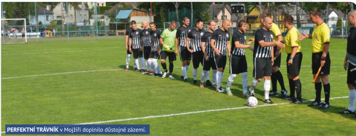
PERFEKTNÍ TRÁVNÍK v Mojžíři doplnilo důstojné zázemí.

a poklábosit si. Už jednáme i o uspořádání příměstského tábora.