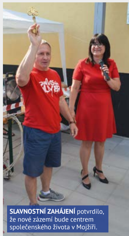
SLAVNOSTNÍ ZAHÁJENÍ potvrdilo, že nové zázemí bude centrem společenského života v Mojžíři.

Nové kabiny nejsou důležité jen ze sportovního, ale i ze společenského hlediska. Jejich součástí je i klubovna, kde se budou scházet místní. Starousedlíci si stadion oblíbili, i oni tak teď mají důstojné místo, kde se sejt