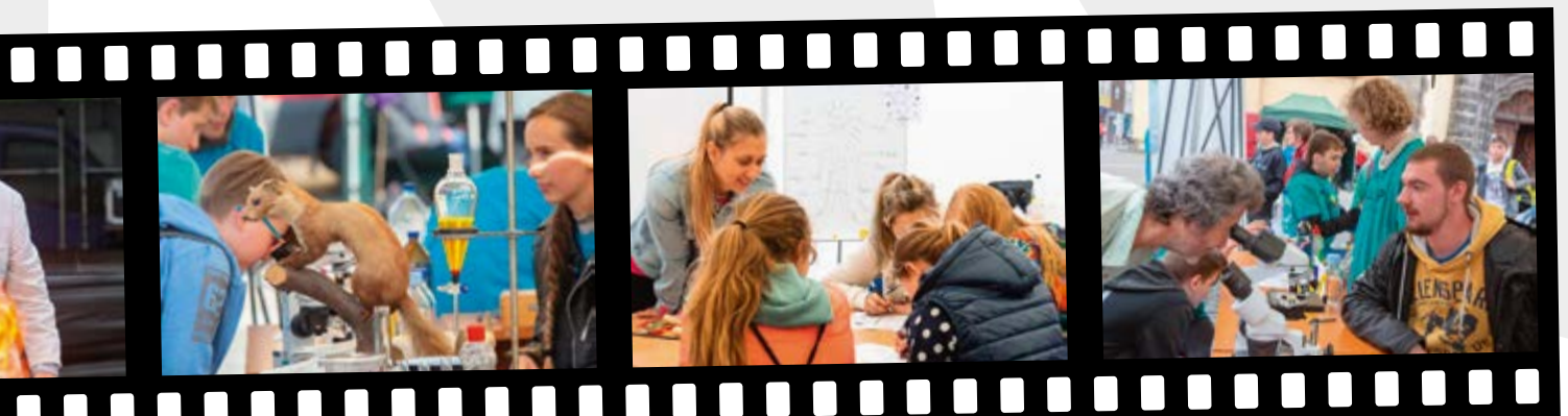
Fotogalerie ze Dnů vědy a umění 2018, které proběhly 16. – 17. května na Kostelním náměstí v centru Ústí nad Labem a v Kampusu UJEP.