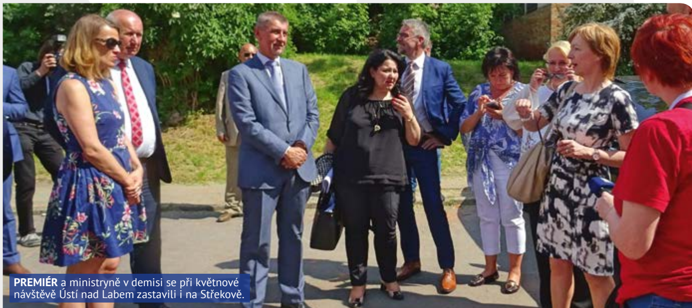
PREMIÉR a ministryně v demisi se při květnové návštěvě Ústí nad Labem zastavili i na Střekově.

NOVĚ ZAVEDENÉ MAGISTRÁTNÍ OPATŘENÍ OBECNÉ POVAHY OMEZUJÍCÍ DOPLATEK NA BYDLENÍ V LOKALITÁCH, KDE SE VYSKYTUJÍ NEŽÁDOUCÍ JEVI, SE TÝKÁ I CENTRÁLNÍHO STŘEKOVA.