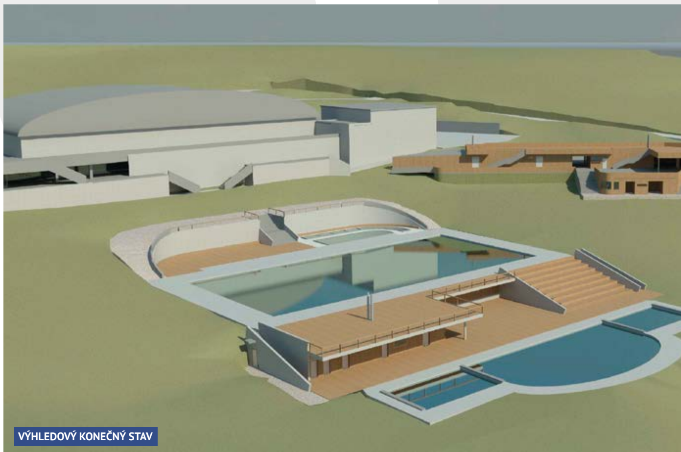
VÝHLEDOVÝ KONEČNÝ STAV

Zastupitelé z Ústeckého fóra občanů (UFO) se ihned po nástupu do