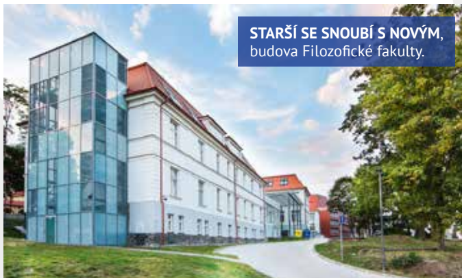
STARŠÍ SE SNOUBÍ S NOVÝM, budova Filozofické fakulty.