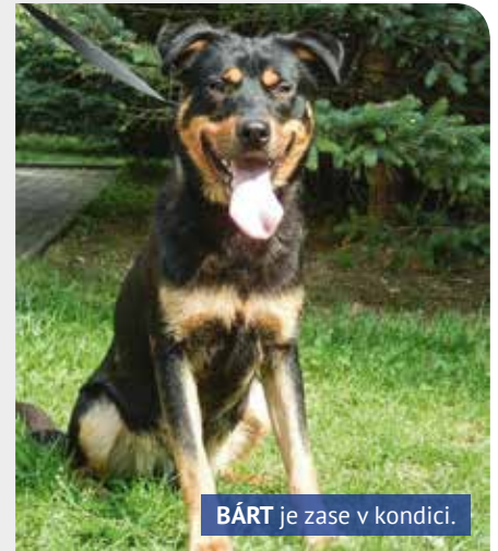
BÁRT je zase v kondici.

Teď už je Bárt zase v kondici a opět čeká,