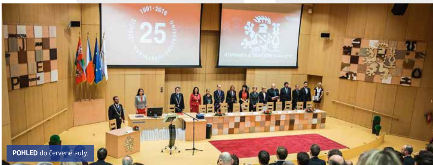
POHLED do červené auly.