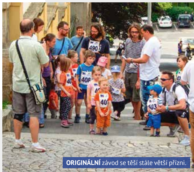
ORIGINÁLNÍ závod se těší stále větší přízni.