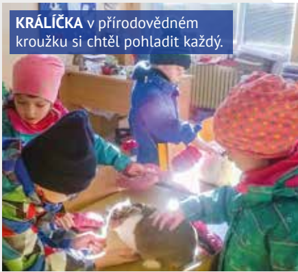
KRÁLÍČKA v přírodovědném kroužku si chtěl pohladit každý.

Není lehké si představit, jaké to je být žáčkem první třídy. To si asi myslí řada dětí z mateřských školek, a proto naše