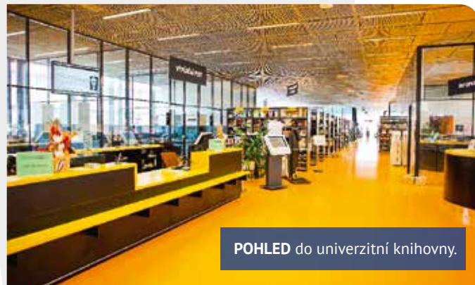
POHLED do univerzitní knihovny.

objekty byly v maximální míře ponechány v původním pojetí včetně repliky autentické fasády.