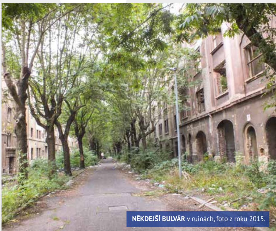
NĚKDEJŠÍ BULVÁR v ruinách, foto z roku 2015.