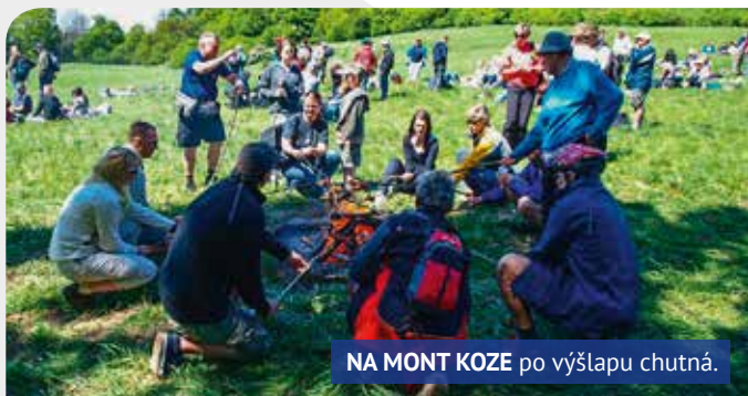
NA MONT KOZE po výšlapu chutná.

KLUB ČESKÝCH TURISTŮ LOKO ÚSTÍ NAD LABEM VT ZVE VŠECHNY PŘÍZNIVCE ZDRAVÉHO POHYBU NA PRVOMÁJOVÝ VÝSTUP NA KOZÍ VRCH.