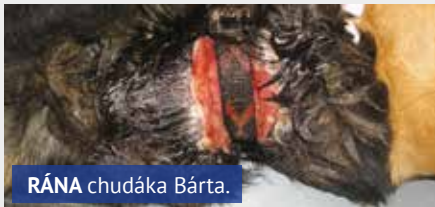
RÁNA chudáka Bárta.

Radost však netrvala dlouho. Za pouhé dva měsíce zavolala do útulku žena, která oznamovala, že na zahradě v Krásném Březně je uvázaný vyhublý pes s osklivou ránou na krku a že majitel na