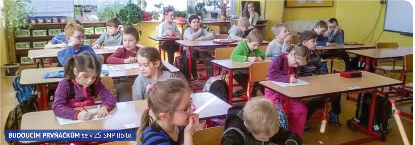
BUDOUČÍM PRVNĚČKŮM se v ZŠ SNP líbilo.

Není lehké si představit, jaké to je být žáčkem první třídy. To si asi myslí řada dětí z mateřských školek, a proto naše