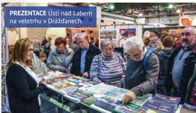
PREZENTACE Ústí nad Labem na veletrhu v Drážďanech.

potvrdili, že ve společnosti dlouho panovaly obavy z účasti na takovýchto masových akcích. Chuť cestovat a poznávat nová místa ale převážila a letošní ročník tak přinesl nový rekord v návštěvnosti tohoto veletrhu: během pěti dní navštívilo veletržní haly více než 135 tisíc lidí. V přepočtu tedy za jeden den v Mnichově přišlo stejně lidí, jako za třídní veletrh v Drážďanech.