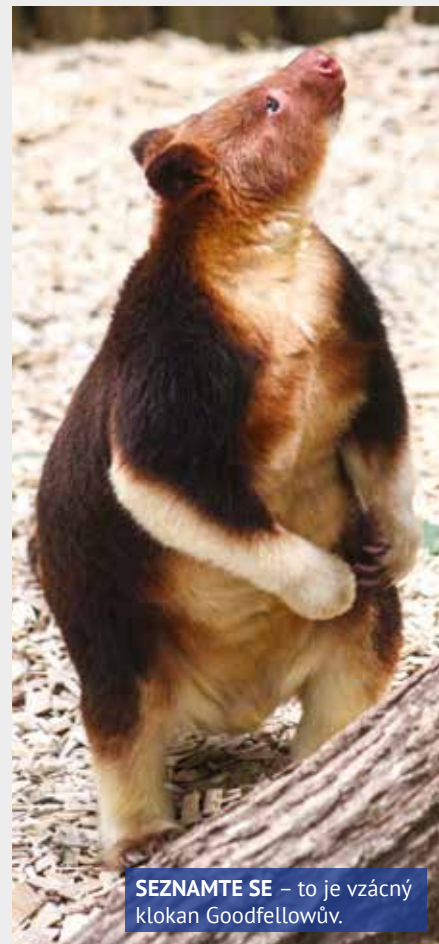
SEZNAMTE SE – to je vzácný klokan Goodfellowův.