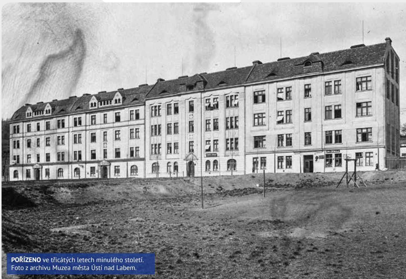
POŘÍZENO ve třicátých letech minulého století.

JMENUJE SE NA NIVÁCH A V JEJÍM OSUDU SE JAKO V KAPCE VODY ODRÁŽÍ LECCOS Z TOHO, ČÍM ŽILO NAŠE MĚSTO POSLEDNÍCH STO LET. POJĎME ZALISTOVAT KNIHAMI, NOVINAMI, VZPOMÍNKAMI.