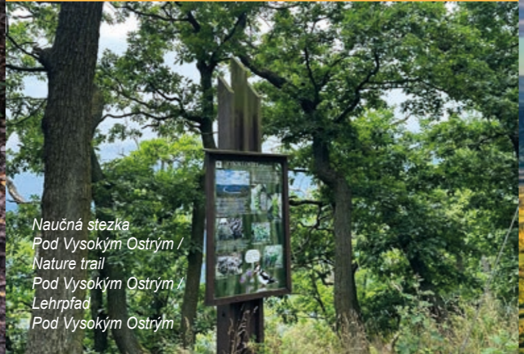
Naučná stezka Pod Vysokým Ostrým / Nature trail Pod Vysokým Ostrým / Lehrpfad Pod Vysokým Ostrým

Die Wanderstrecke beginnt in Brná bei der Kapelle St. Anna und führt durch die Průčelská-Schlucht über den Aussichtspunkt Vysoký Ostrý bis zur Burg Sřtekov. Auf einer Länge von 8,5 km bietet die Strecke 17 Informationstafeln mit Informationen über die lokale Fauna, Flora und andere Sehenswürdigkeiten. Wenig bekannt ist, dass die düstere Romantik der Průčelská-Schlucht offenbar eine der Inspirationsquellen des deutschen Romanautors Karl May war.