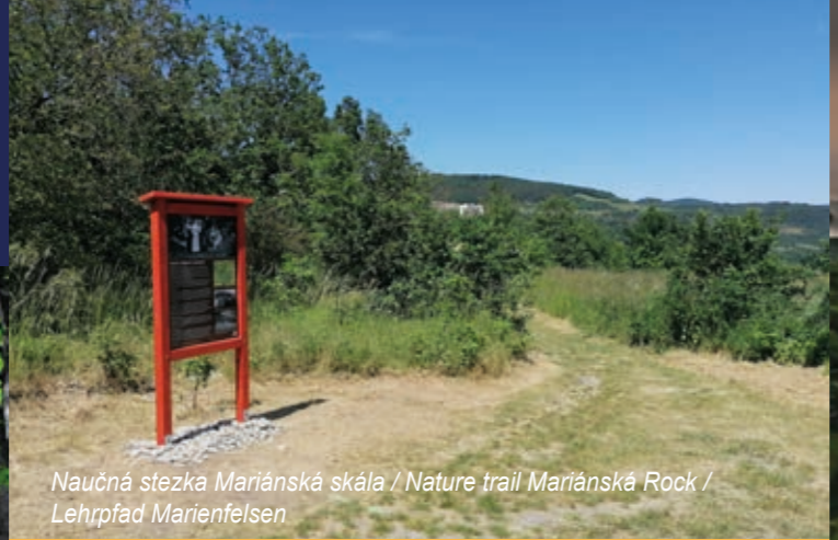
Naučná stezka Mariánská skála / Nature trail Mariánská Rock / Lehrpfad Marienfelsen