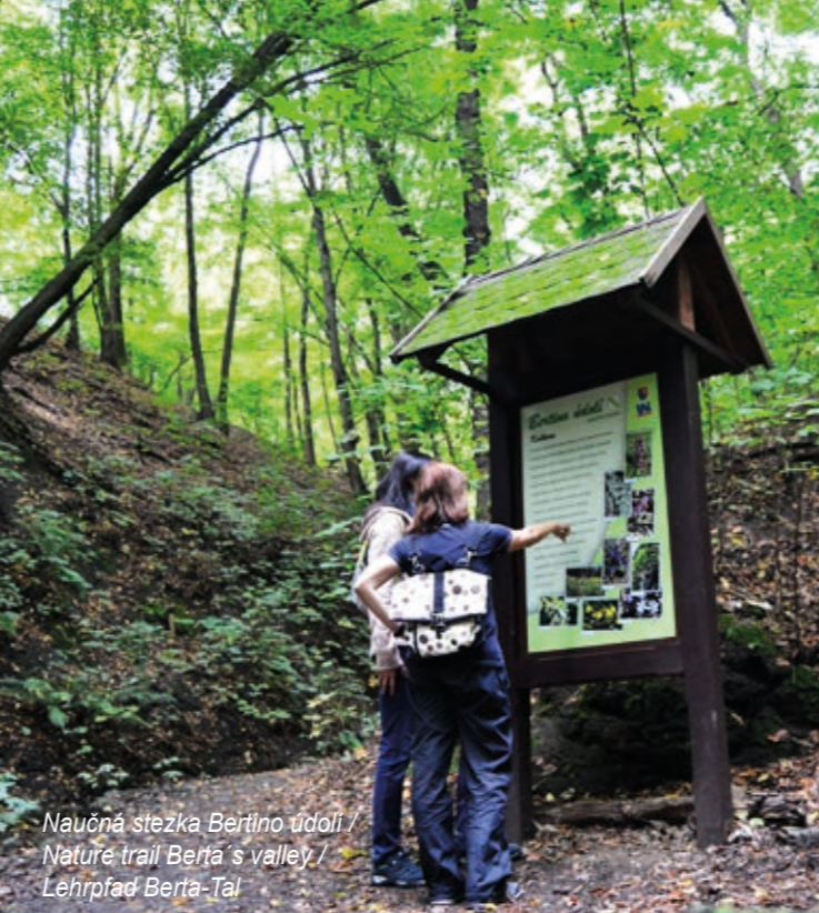
Naučná stezka Bertino údolí / Nature trail Berta's valley / Lehrpfad Berta-Tal