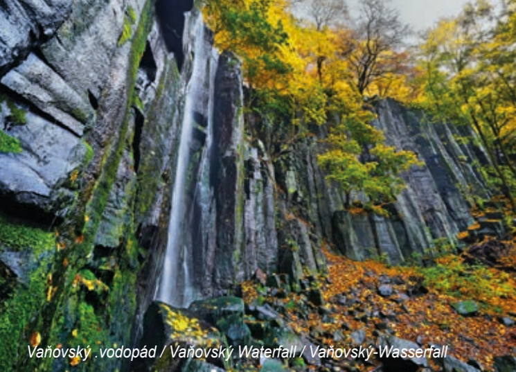
Vaňovský vodopád / Vaňovský Waterfall / Vaňovský-Wasserfall