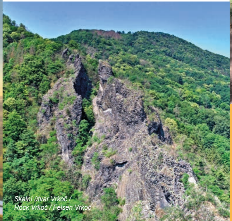
Skální útvar Vrkoč / Rock Vrkoč / Felsen Vrkoč

Der Lehrpfad entstand anlässlich des hundertjährigen Jubiläums der Gründung des ersten Vogelschutzgebiets in Mitteleuropa im Jahr 1908. Es wurde vom Unternehmer und Ornithologen Heinrich Lumpe aus Ústí nad Labem gegründet und später entstand an seiner Stelle der heutige Zoo. Der Pfad mit 10 Stationen präsentiert die Geschichte des Lumpeparks, zum Beispiel die Zwergenburg oder den versteinerten Wald.