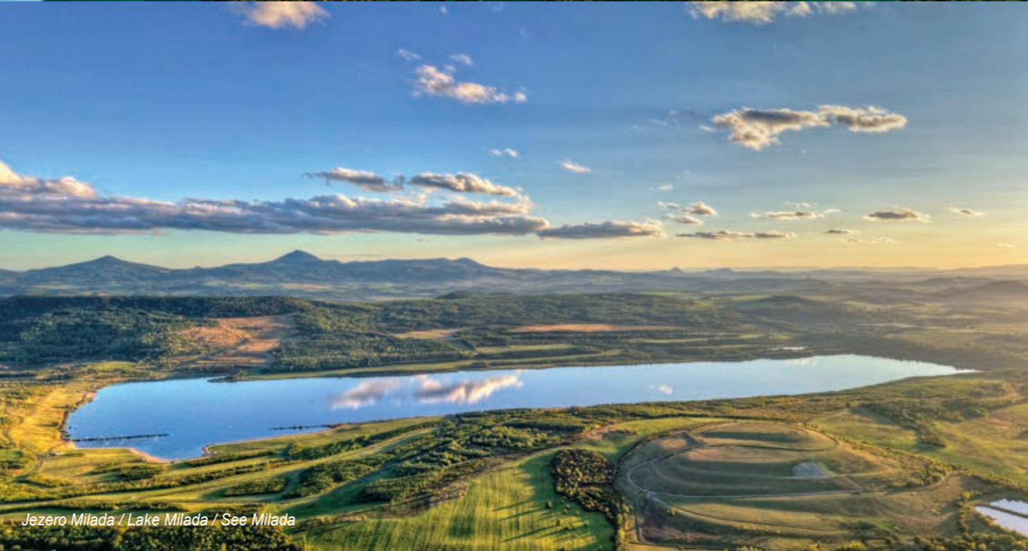
Jezero Milada / Lake Milada / See Milada