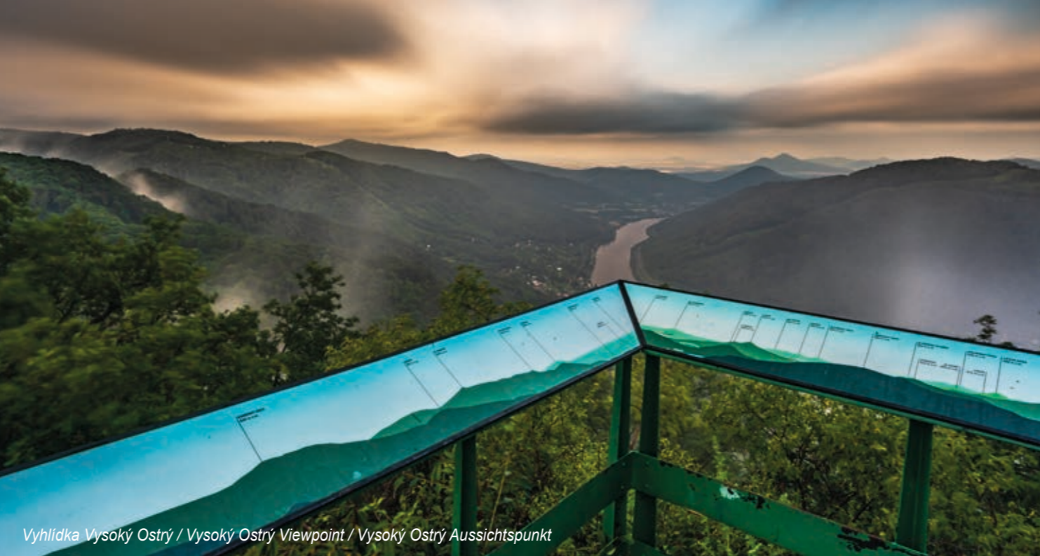
Vyhlička Vysoký Ostrý / Vysoký Ostrý Viewpoint / Vysoký Ostrý Aussichtspunkt